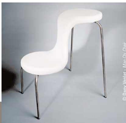
© Dany Venlet - Man Chi Chair

Scapa of Scotland, boegbeeld van sportieve moderniteit, en Xandres waren de eerste Belgen die zich hier vestigden naast het prestigieuze