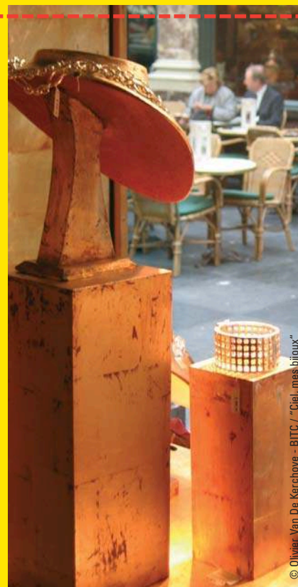
© Olivier Van De Kerchove - BITC / "Ciel, mes bijoux"

De Prinsengalerij loopt dwars op de Koningsgalerij en de Koninginnegalerij. Ook daar wachten u enkele verrassingen. Na het Belle Epoque decor van de boekhandel Tropismes, komt u bij Danaqué, met een verbazingwekkend assortiment van Belgische en Duitse creaties. Alleen al de "look" van de schoenen is een omweg waard!